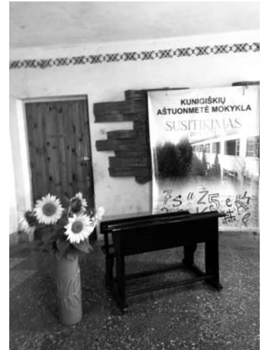
Vaidas kaip tikroje mokykloje. Renginiui papuošti labai pritiko iš muziejaus atgabentas senoviškas mokyklinis suolas.

O koks gi sambūris be muzikos garsų, linksmų dainų? Pakako ir pramogų. Nuotaikingą koncertą