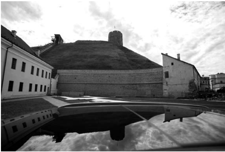
Gedimino kalno tvarkymo projektą už 2,2 mln. rengs „Hidroterra“

Gedimino kalno Vilniuje galutinio sutvarkymo projektą už 2,18 mln. eurų rengs bendrovė „Hidroterra“, pirmadienį pranešė Lietuvos nacionalinio muziejaus atstovai.