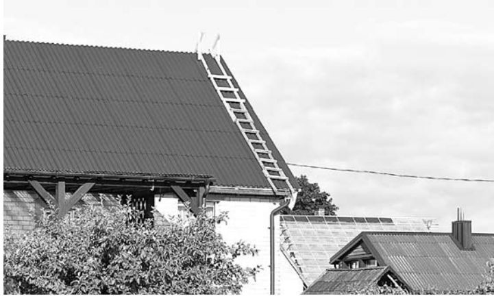
Paramos lėšomis kompensuojamos išlaidos stogo dangai ir statybinėms medžiagoms, būtinoms stogo dangai pakeisti.

Vis daugiau kaimo gyventojų naudojami parama sveikatai pavojingai asbestinei stogo dangai pakeisti.