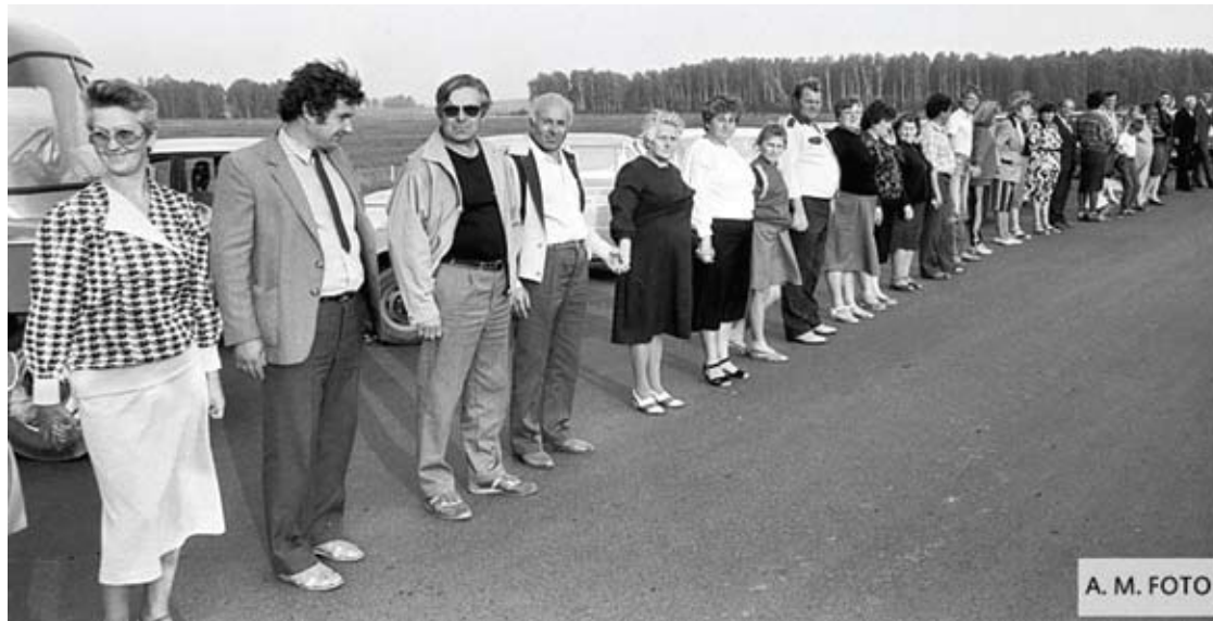
Anykštėnų rankų užteko 5 kilometrams Baltijos kelio.

Rugpjūčio 23-iają Lietuva, Latvija ir Estija minės Baltijos kelio 30-metį. 1989 m. rugpjūčio 23-iają, minint šios sukakties 50-metį, į gyvą, 620 kilometrų nusidriekusią grandinę nuo Gedimino bokšto Vilniuje iki Tompėjos bokšto Taline sustoję Lietuvos, Latvijos ir Estijos žmonės priminė visam pasauliui niekada nepamirštą siekį būti laisviems, teisę patiems kurti savo valstybes.