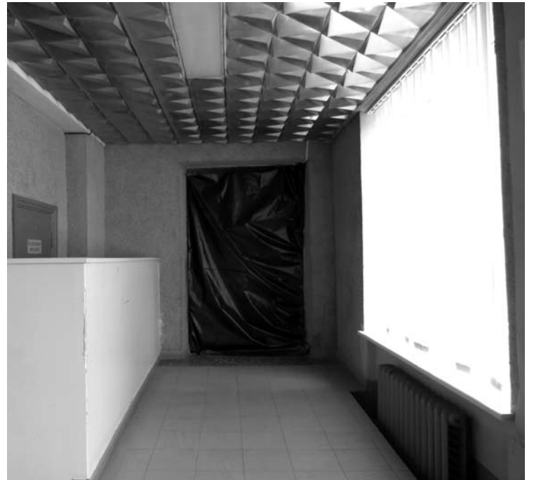
Pamokos senajame progimnazijos pastate galės vykty tik kitais metais.

Tai - jau nebe pirmas atvejis, kai, prasidėjus mokslo metams, moksleiviams erdves ugdymo įstaigose tenka dalytis su statybininkais. Taip jau buvo nutikę remontuojamoje Anykščių Jono Biliūno gimnazijoje. Tuomet dėl kylančių dulkių bei nuolatinio darbininkų įrankių keliamo triukšmo skundėsi tiek moksleiviai, tiek ir jų tėvai.