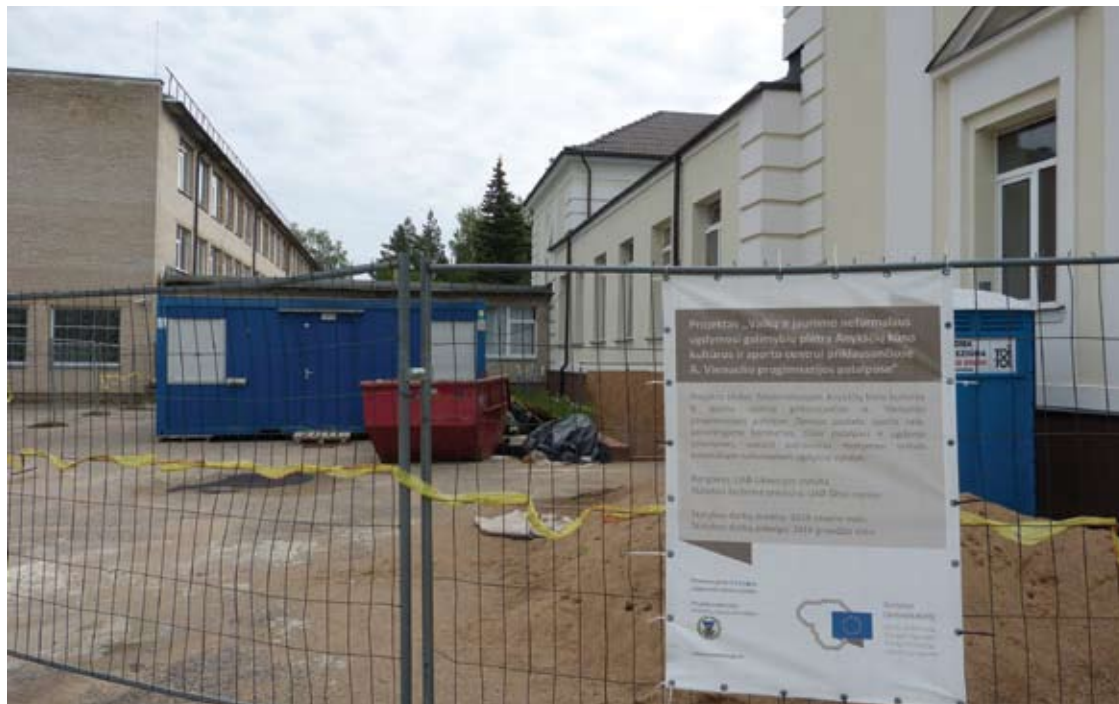
Bendra Anykščių Antano Vienuolio progimnazijos modernizacijos projekto vertė siekia 324 tūkst. 706 eurų.

Robertas ALEKSIEJŪNAS robertas.a@anyksta.lt