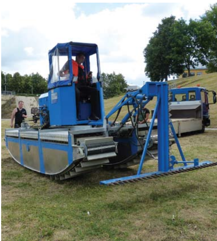
Amfibija žiemos UAB Anykščių komunalinis ūkis garaže.